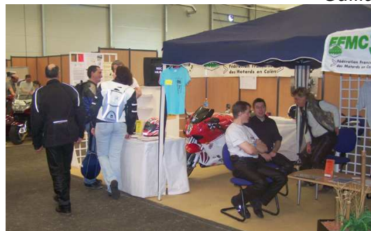
Le stand FFMC37 au Salon de la Moto